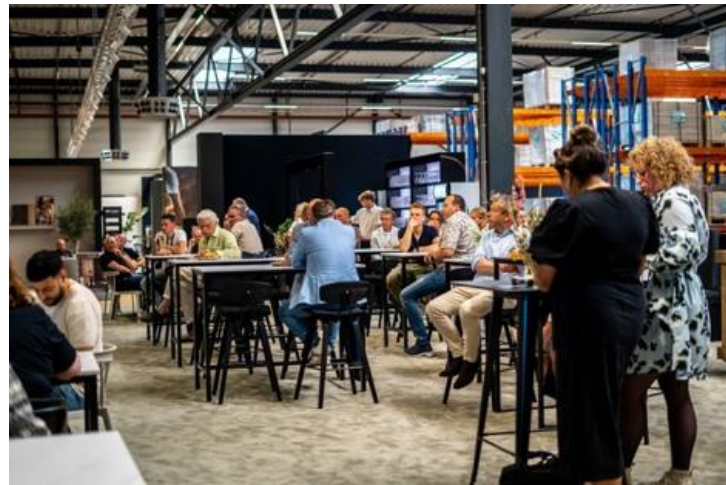
Gastvrije ontvangst tijdens de COTAP-dagen