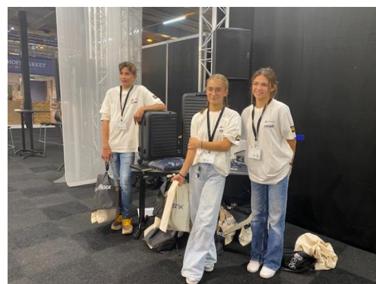
Bij het VMBO twee dames bij de eerste drie!

Het is een goede actie om ook het VMBO meer te betrekken bij onze opleiding. Een mooi voorbeeld is de plaatselijke actie in Mijdrecht waarbij ook ons lid DEN OUDEN vloer, wand en raamdecoratie zijn bijdrage leverde. Dit samen met o.a. een regionaal schildersbedrijf en andere vakbedrijven. Zo werden de VMBO-leerlingen daar in de gelegenheid gesteld om ook met ons vakgebied kennis te maken! Echt een goede actie in Mijdrecht, maar elders kan dat natuurlijk ook georganiseerd worden! Zo zie je maar weer dat plaatselijke initiatieven ook hun vruchten kunnen afwerpen. Bijgaand nog wat impressies vanuit InCoDa met de jongeren die met het vak kennismaken of er via het MBO mee bezig zijn. Veel actie van alle kanten geeft ook veel reactie en nee, het gaat niet vanzelf, we moeten er met zijn allen aan blijven werken om nieuwe vakmensen aan te trekken. Zoals al vaker gezegd, wij blijven ons ervoor inspannen.