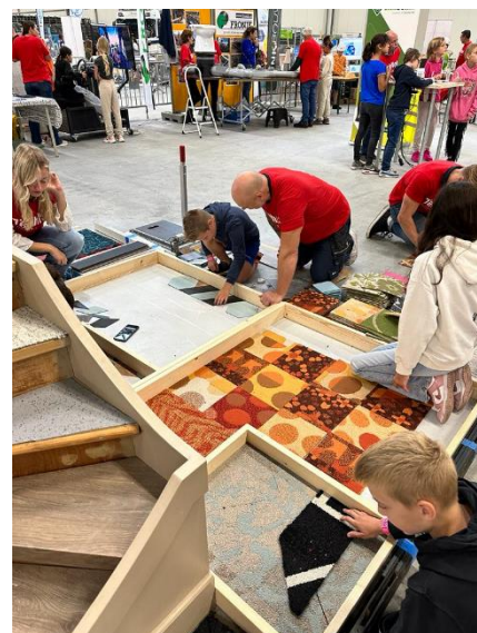
Een mooi beeld bij de stand van Den Ouden