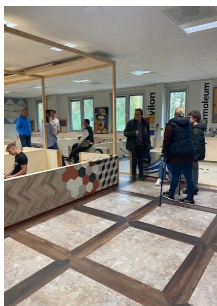
Hout- en Meubilerings College