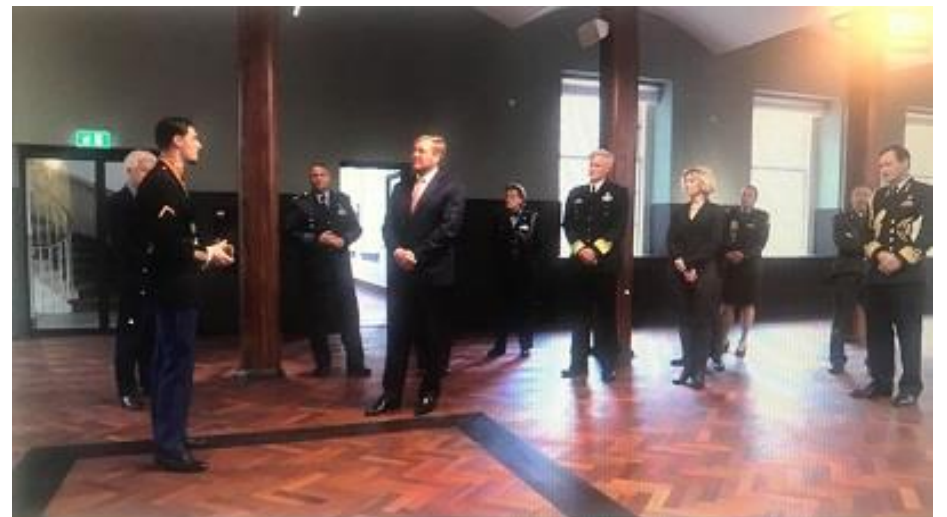
Koning Willem-Alexander heropent het Kasteel van Breda