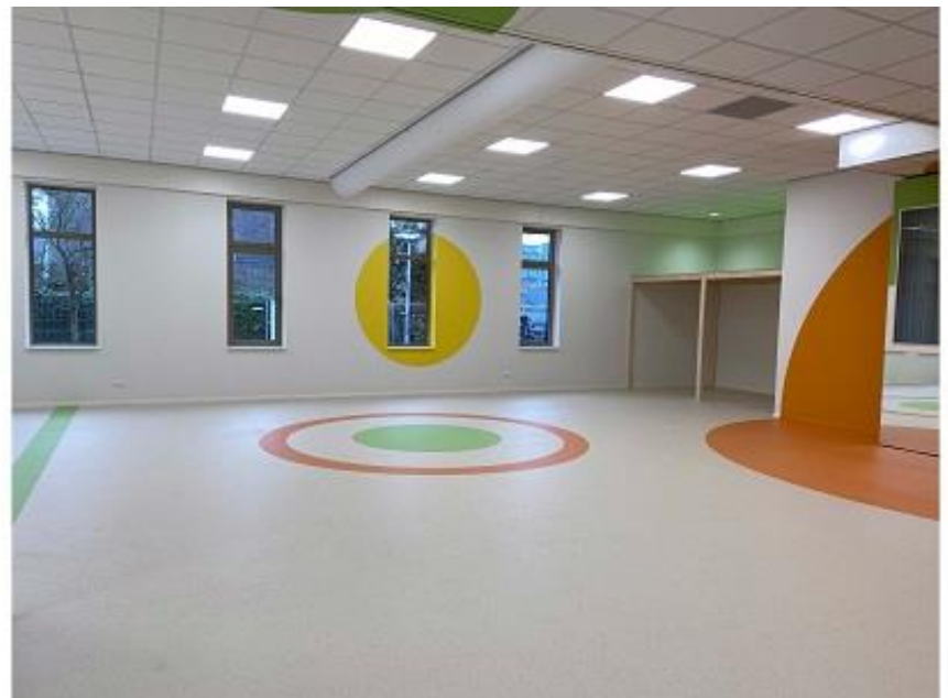
PMR Projectstofferung, Nachtschadestraat 12, 3053 JW Rotterdam info@pmr-bv.nl

Fijn dat de onderneming lid is van de Branchevereniging Projectinrichting.